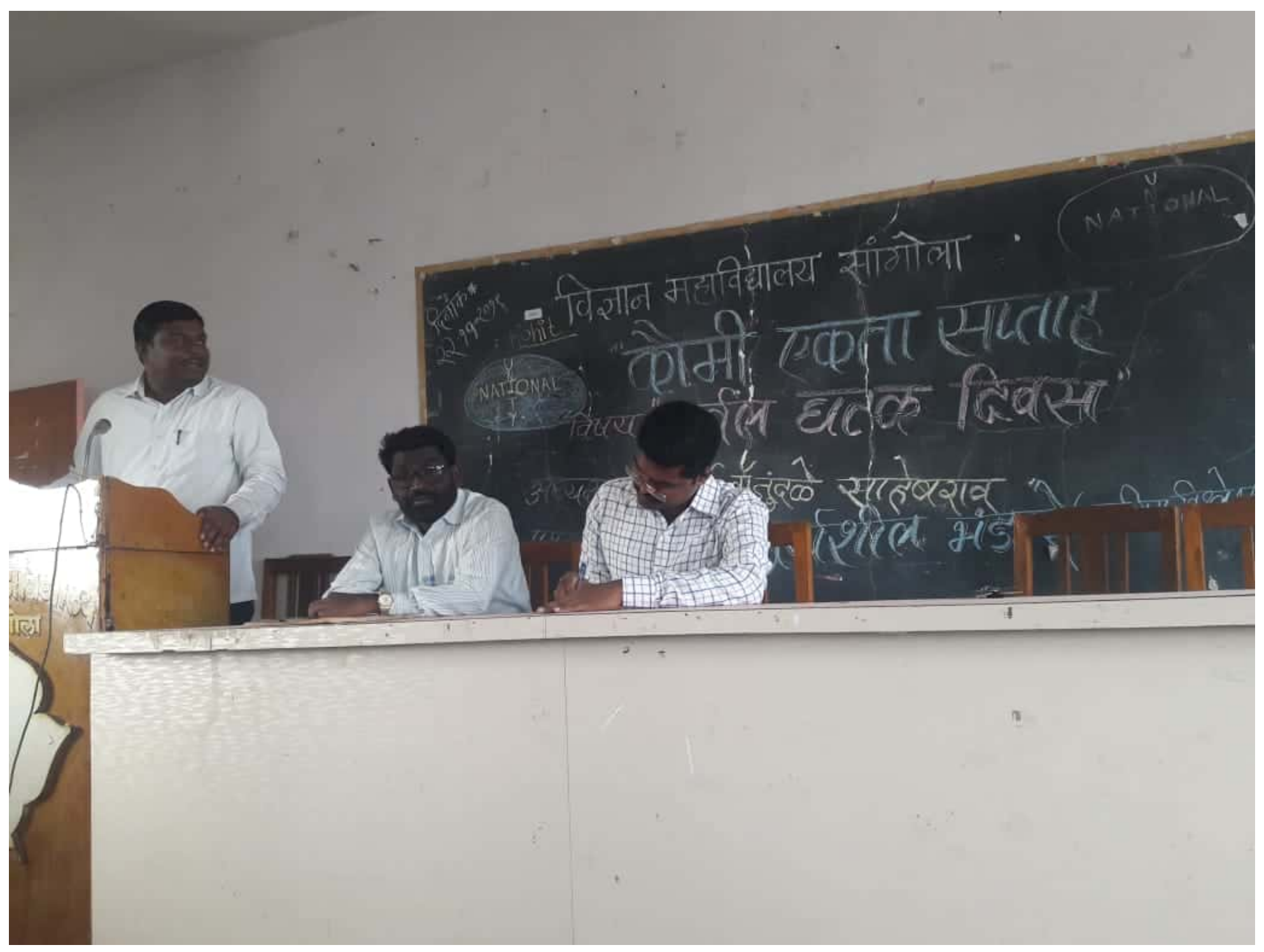
Scanned by CamScanner