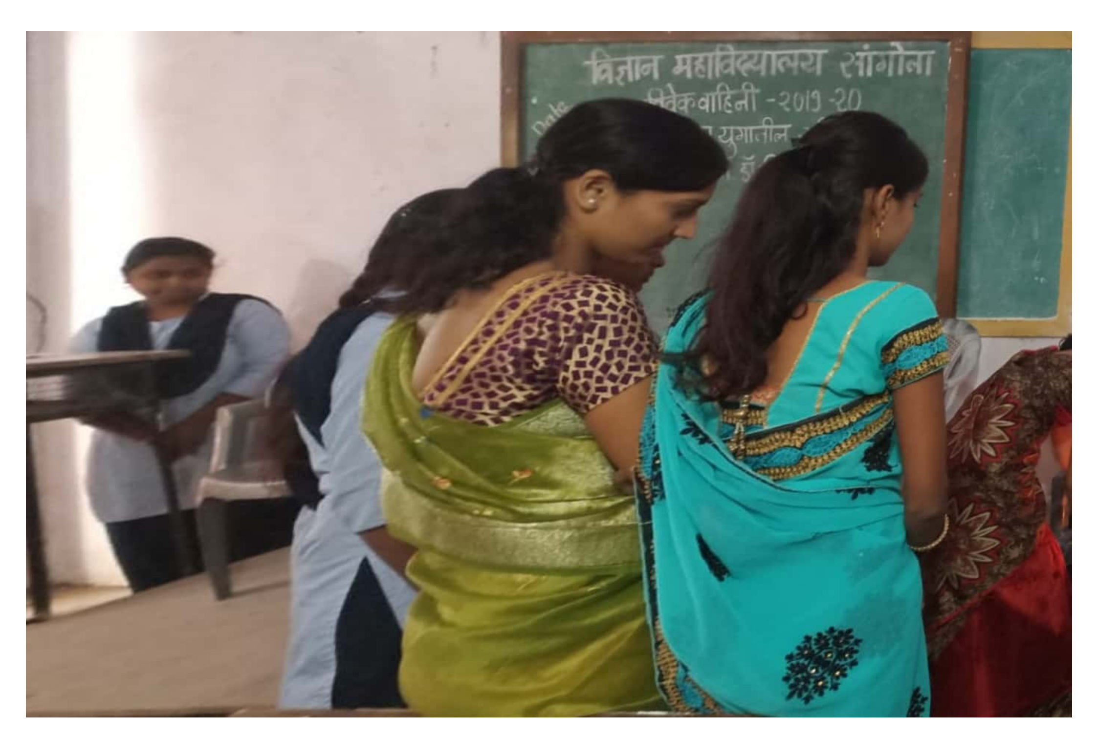
Scanned by CamScanner