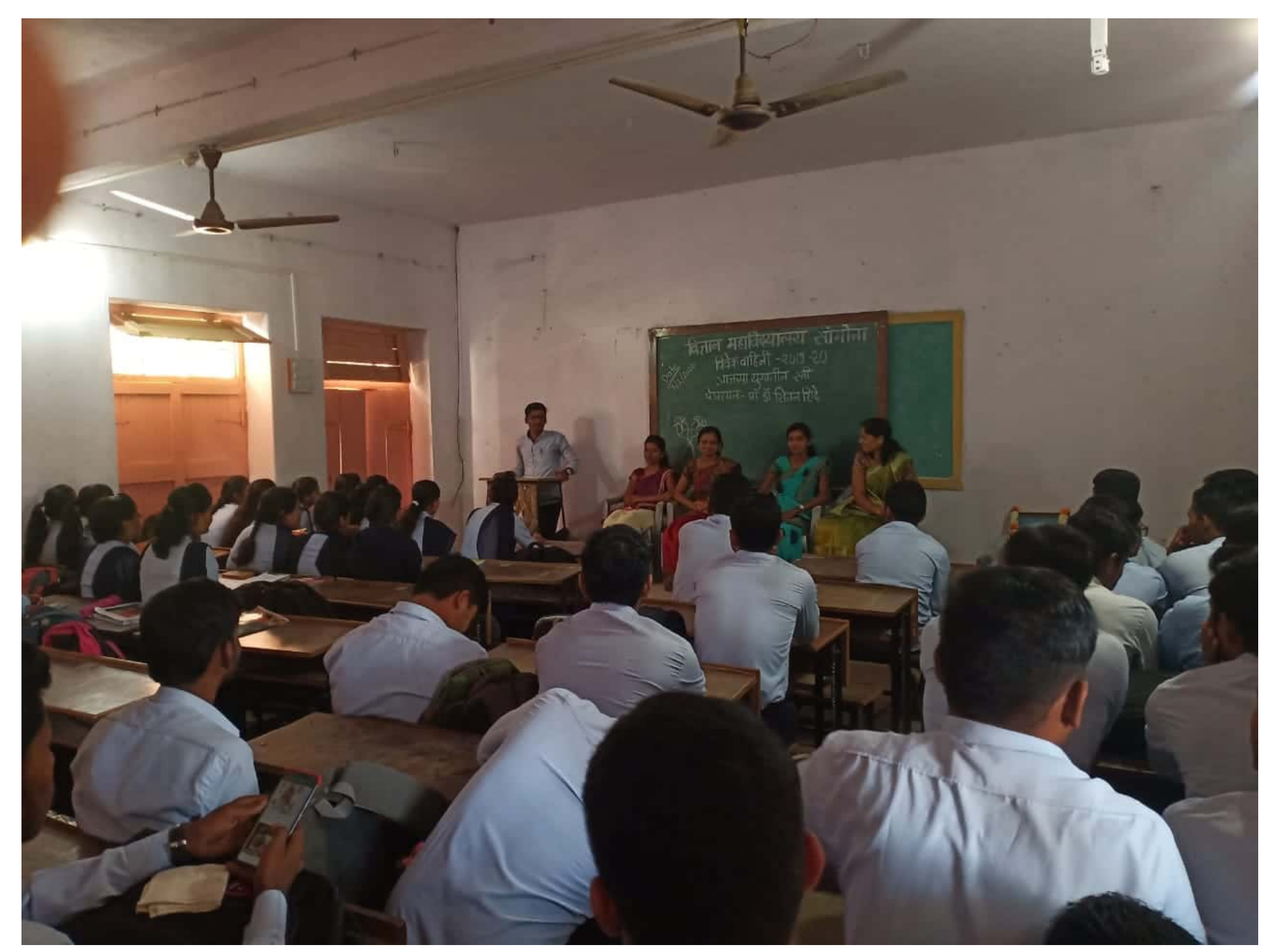
Scanned by CamScanner