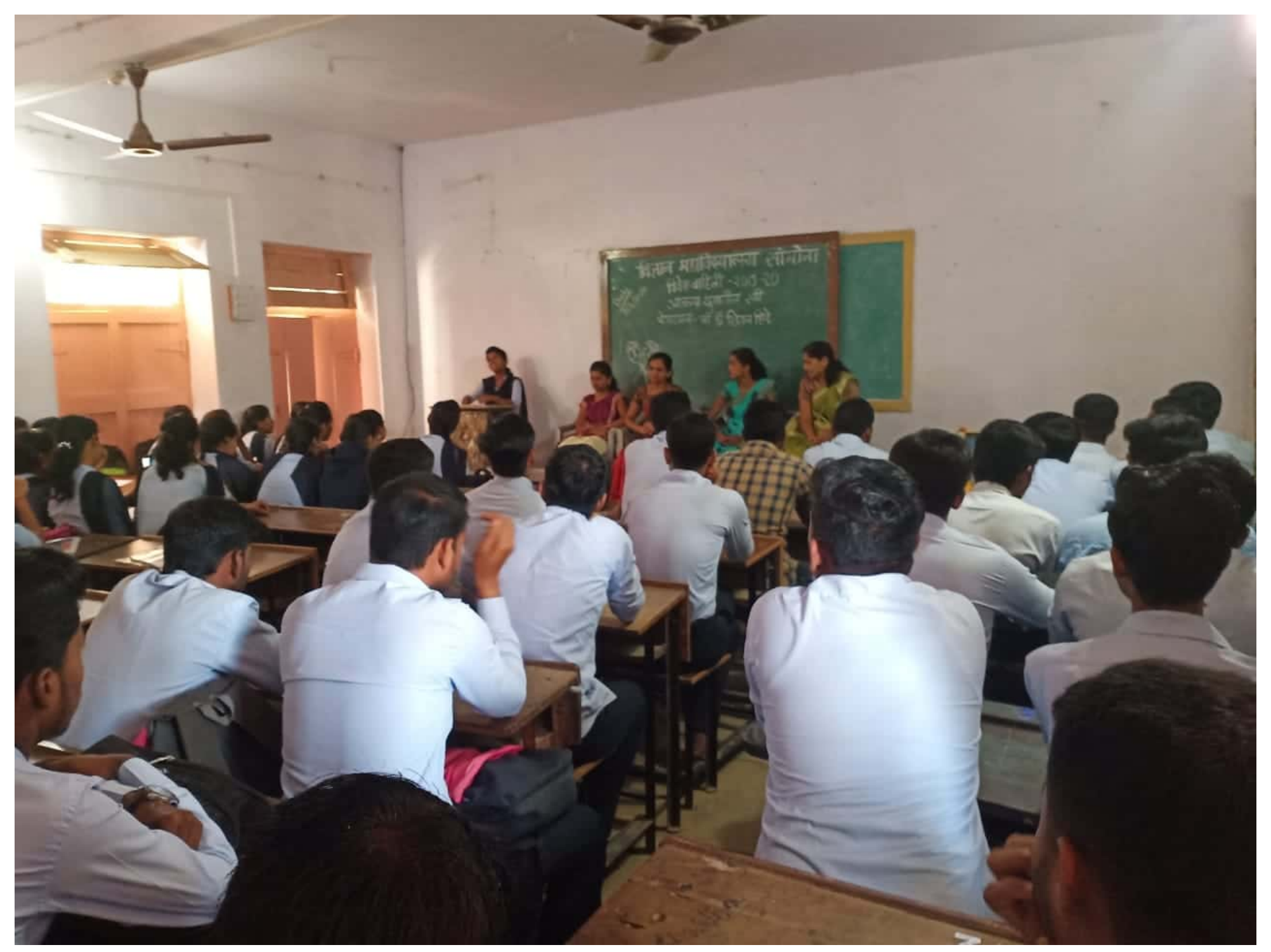
Scanned by CamScanner