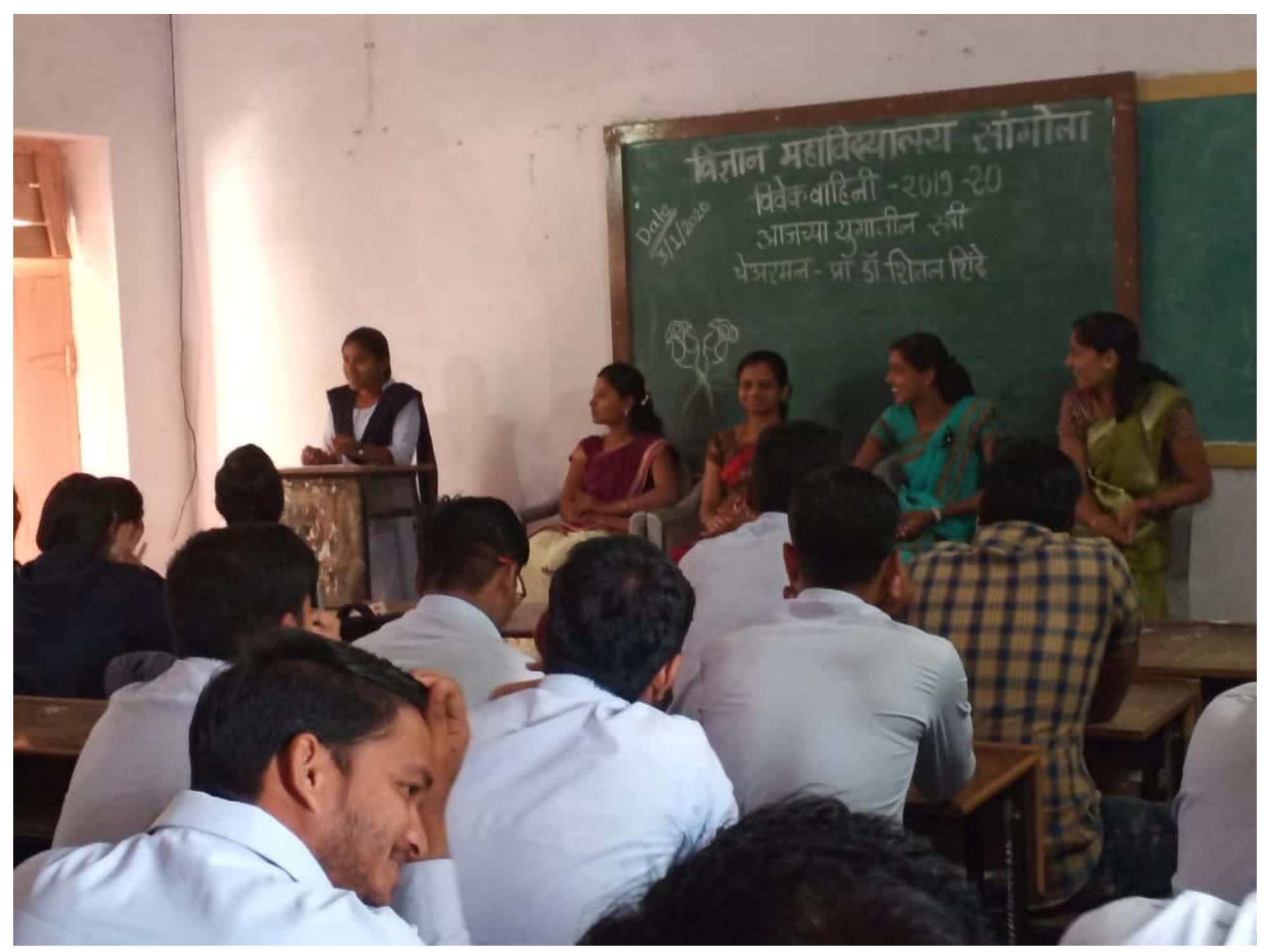
Scanned by CamScanner