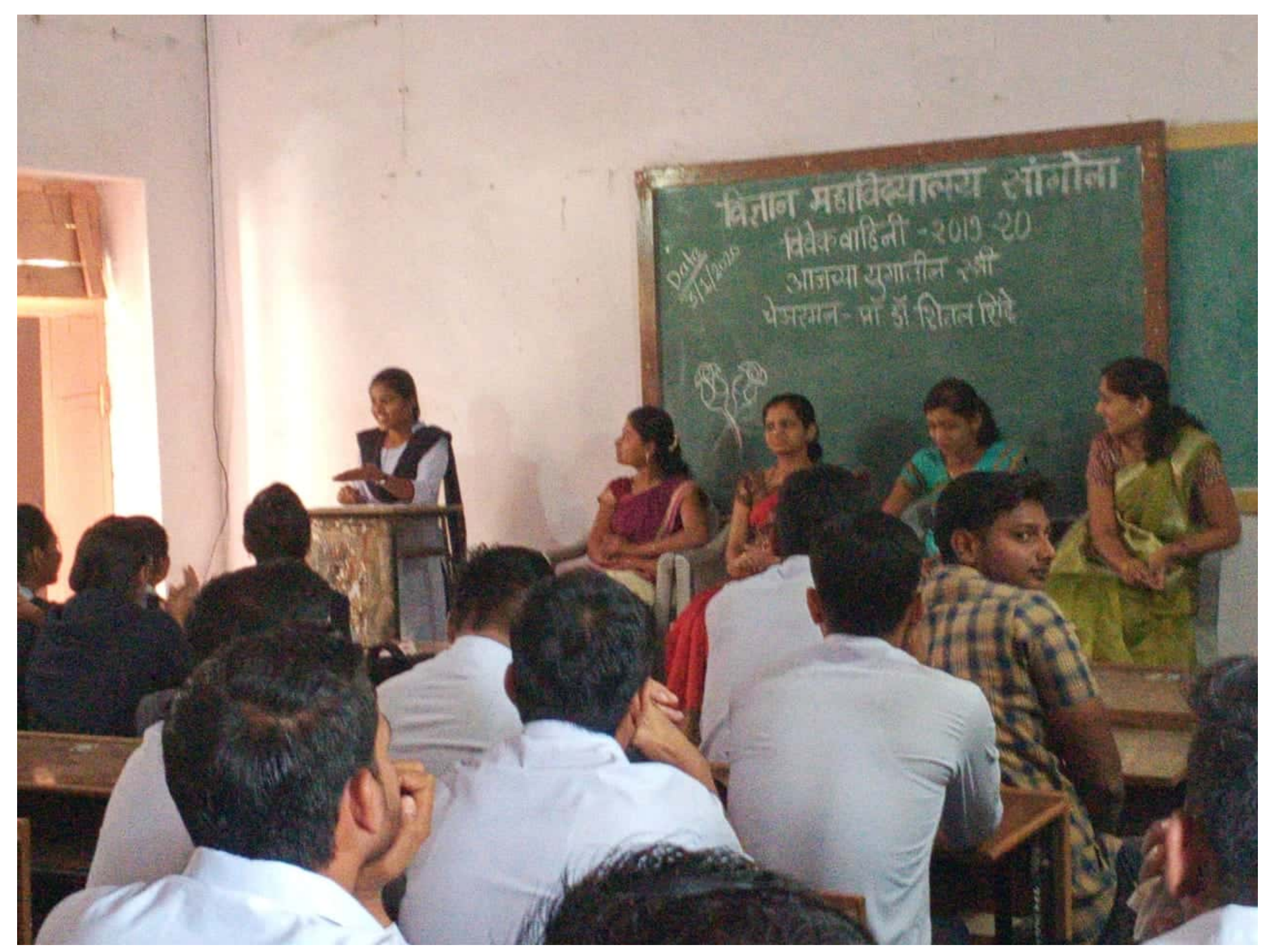
Scanned by CamScanner