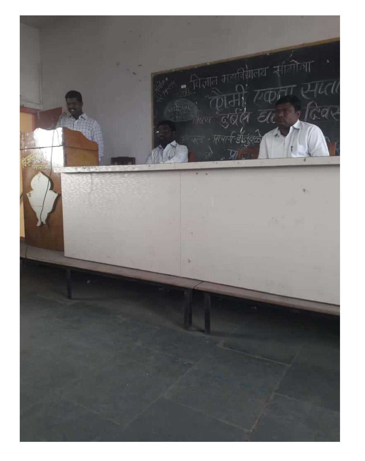
Scanned by CamScanner