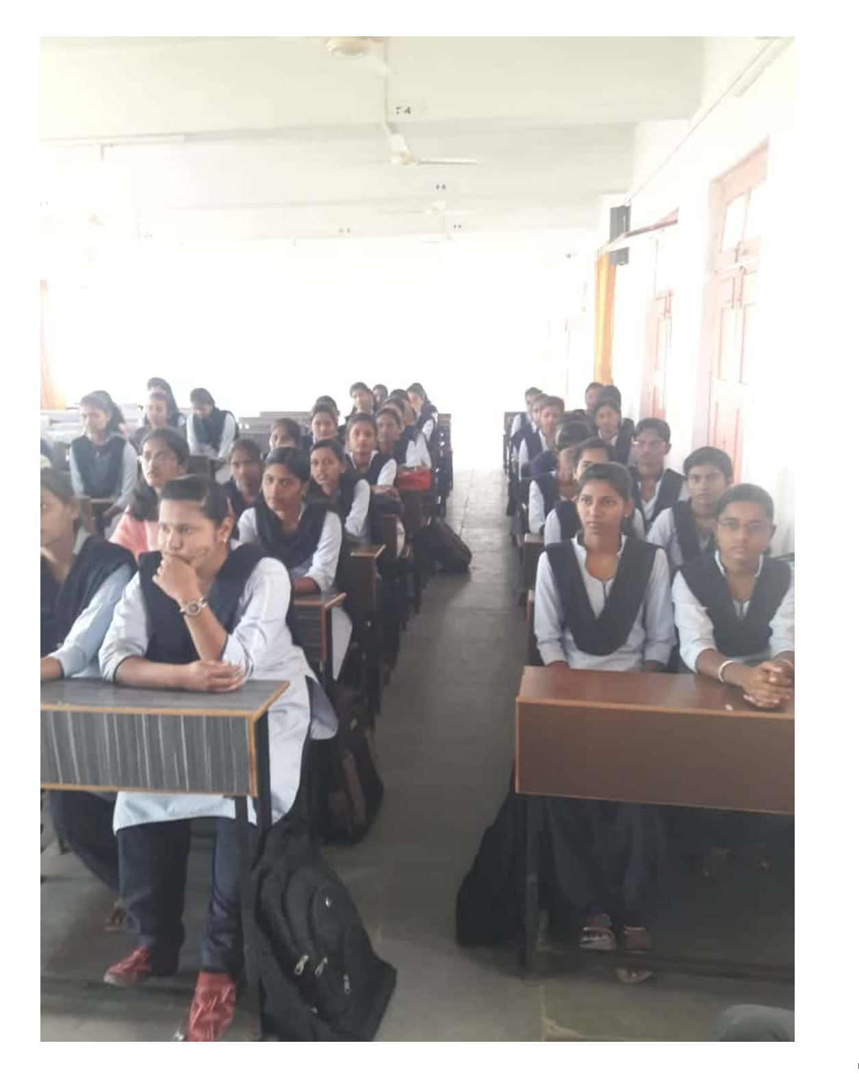
Scanned by CamScanner