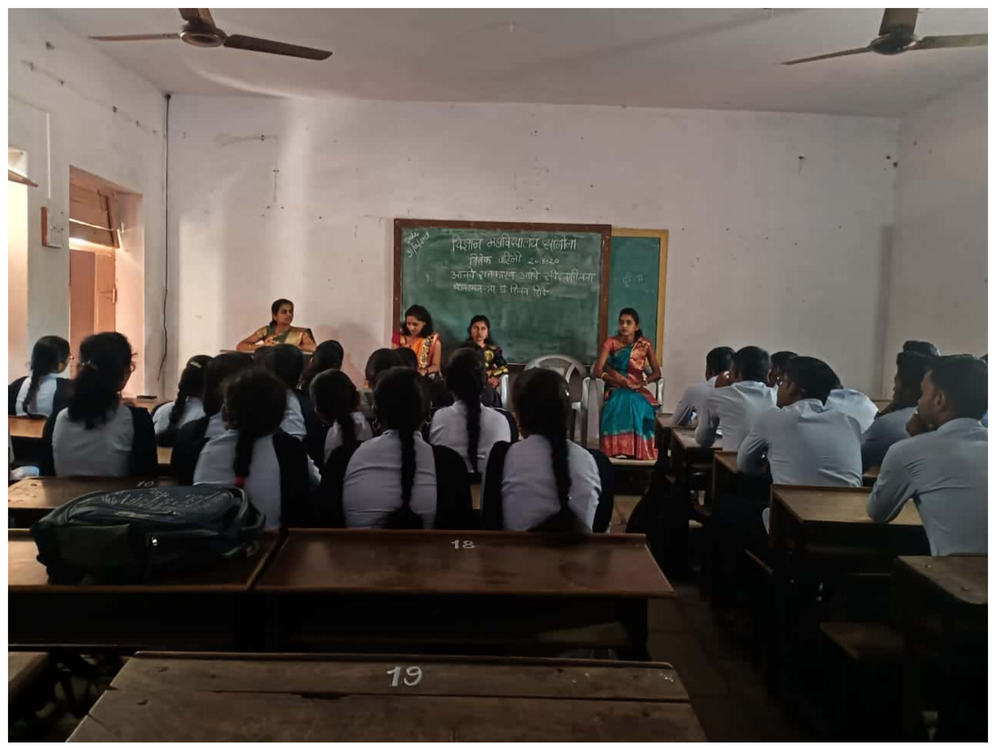
Scanned by CamScanner