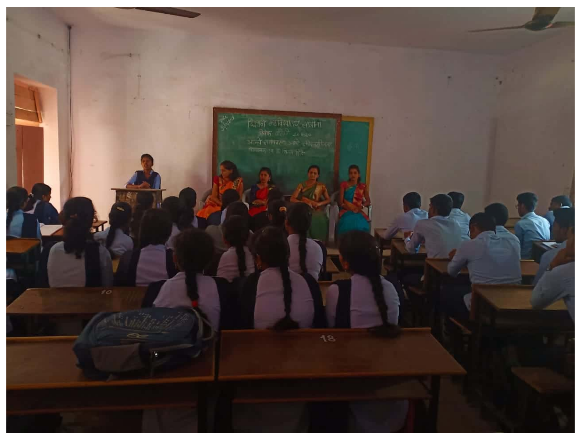
Scanned by CamScanner