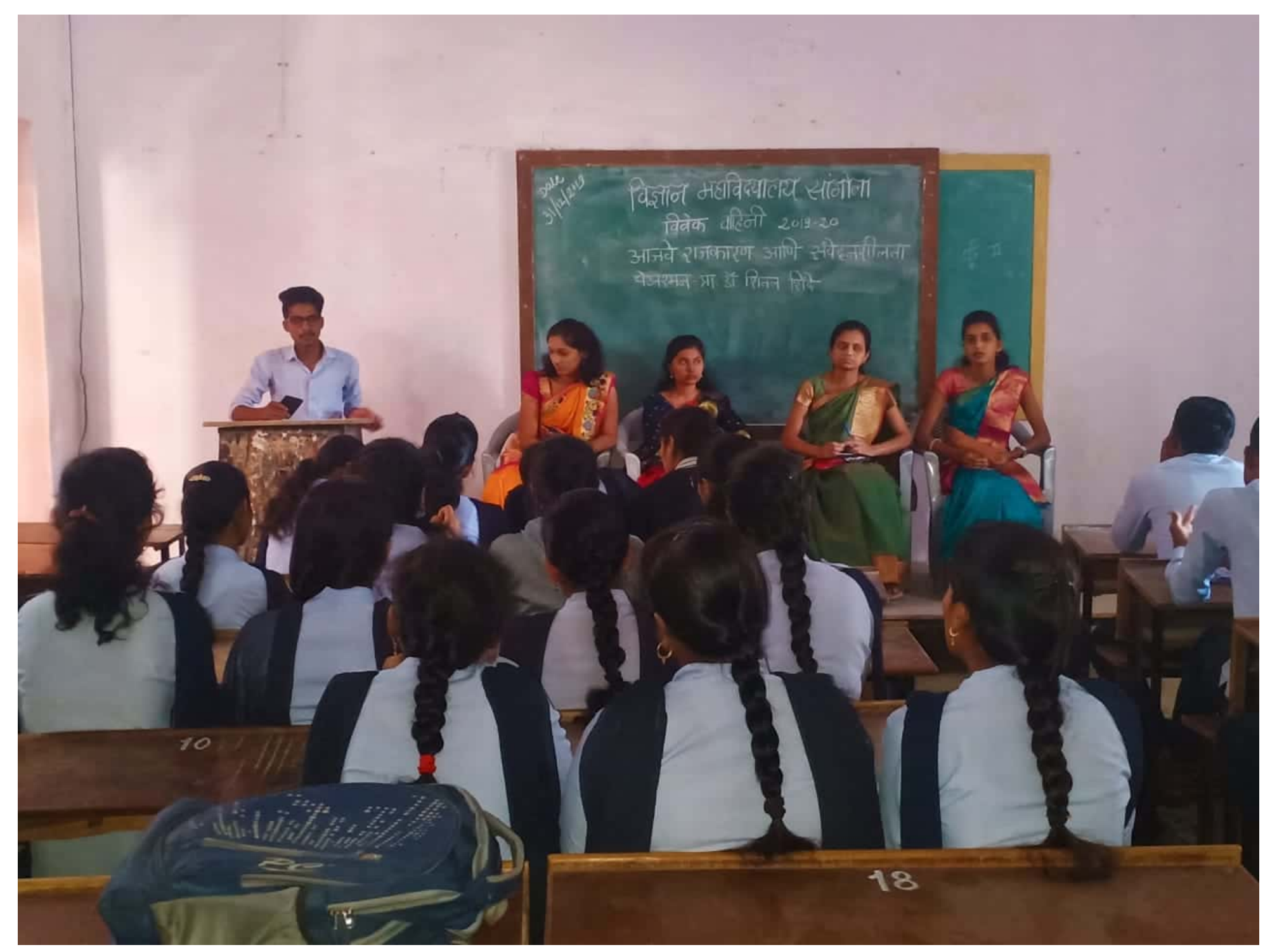
Scanned by CamScanner