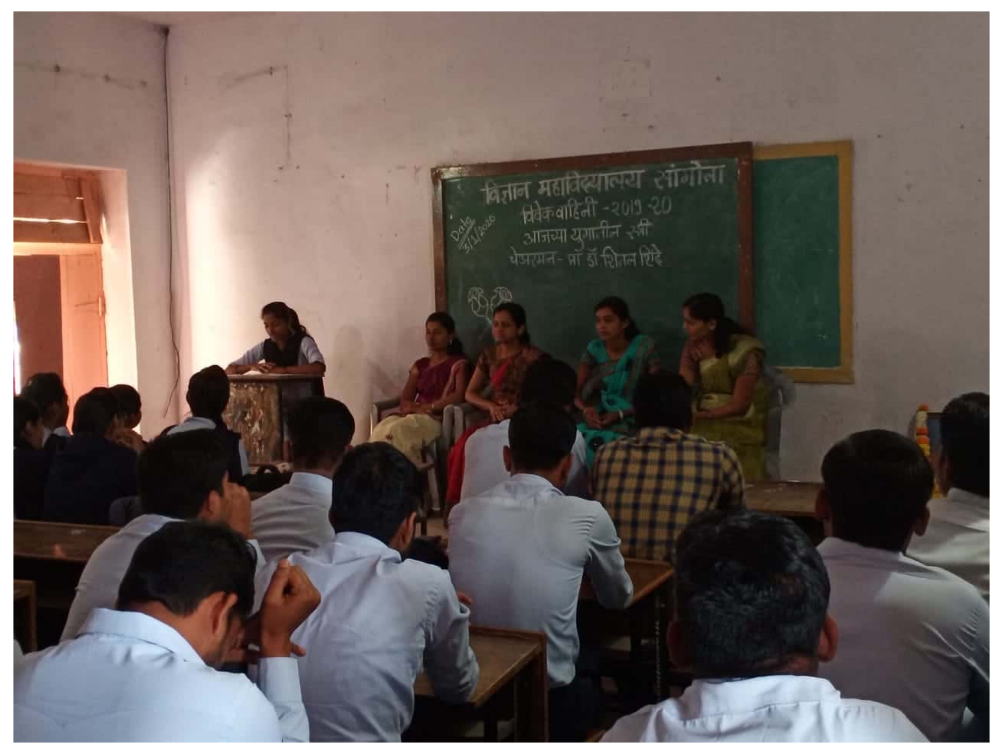
Scanned by CamScanner