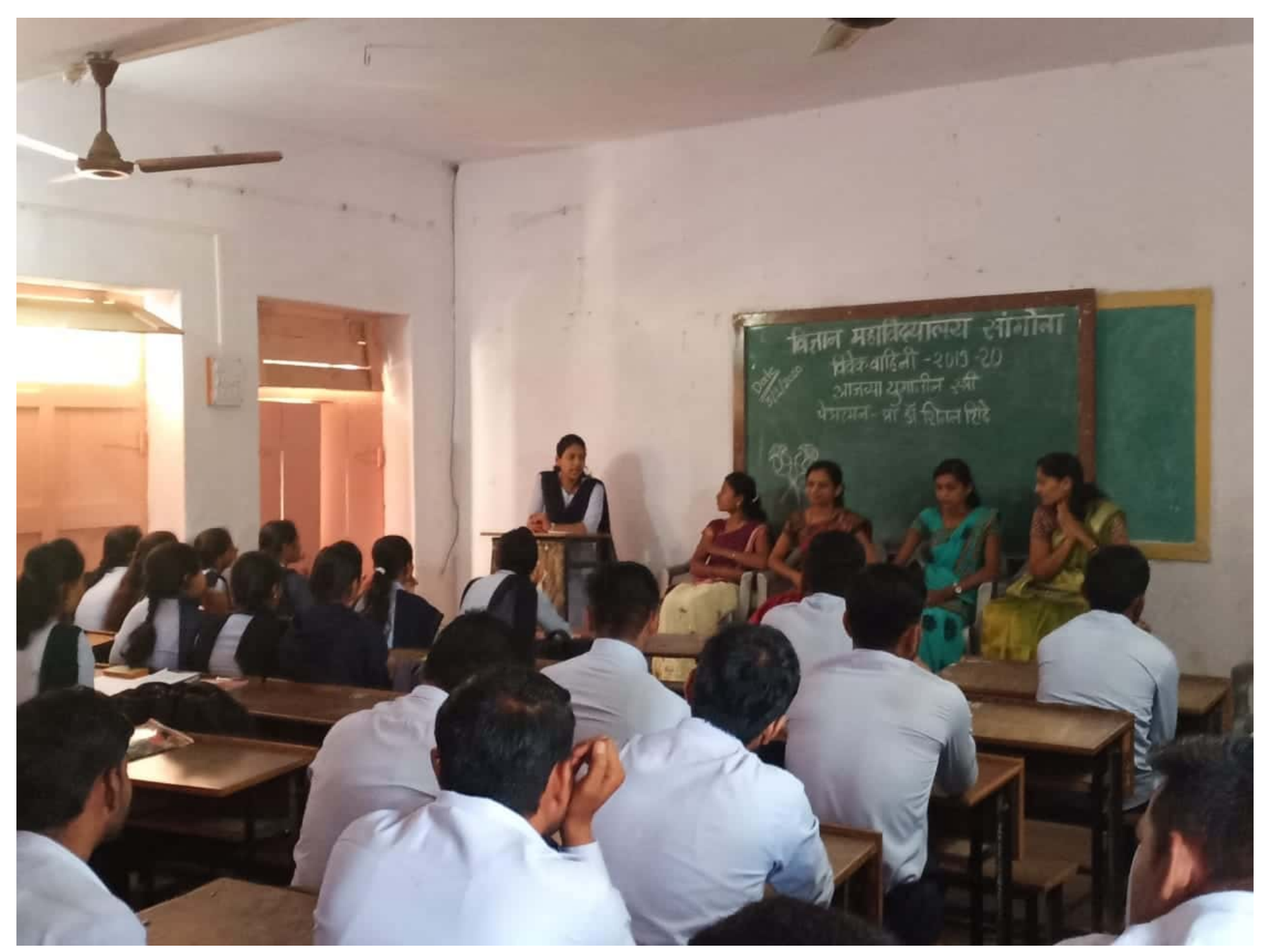
Scanned by CamScanner